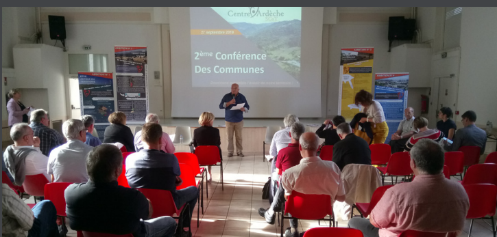
Conférence des communes, 27 septembre 2019.

Présentation des Ambitions du PADD, retour d'expérience du SCoT Apt Luberon, Table ronde : Quelle économie pour le développement et l'attractivité du Centre Ardèche ?