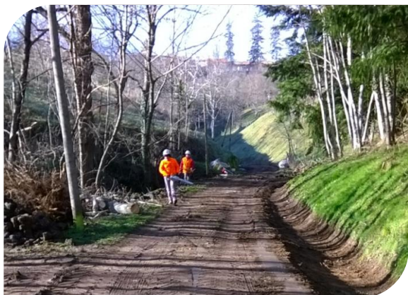
Poursuite de l'aménagement de la Dolce Via vers St-Agrève : 1,9 M €