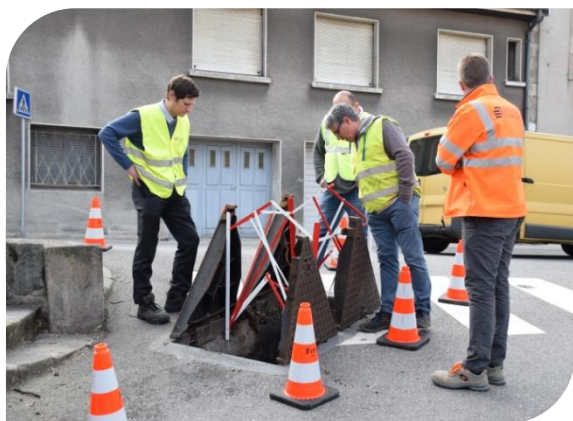
Déploiement de la fibre optique : 690 000 €