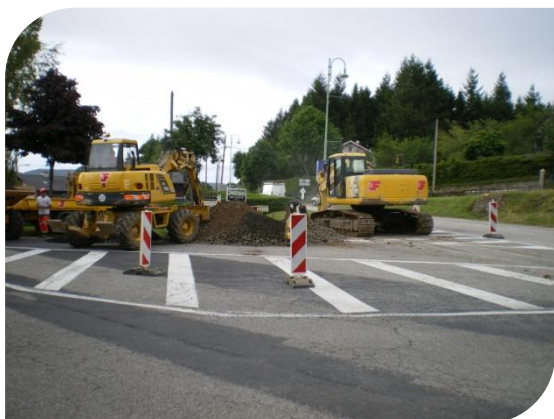
Programme de travaux en eau et assainissement : 7,8 M €