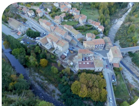
Atelier du Bijou à St-Martin-de-Valamas : 820 000 €