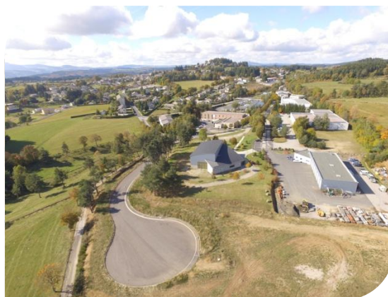
Aménagement de la ZA de Rascles à St-Agrève : 400 000 €