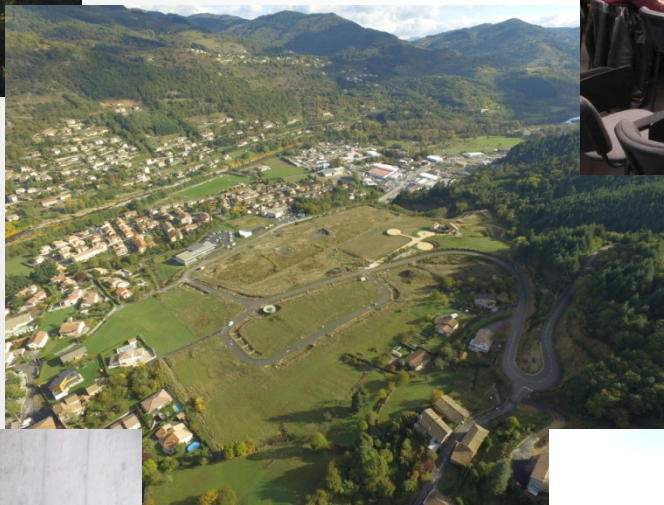
Zone d'activité Aric Industrie Le Cheylard