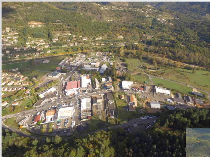
Zones d'activité de La Palisse et des Prés de l'Eyrieux Le Cheylard