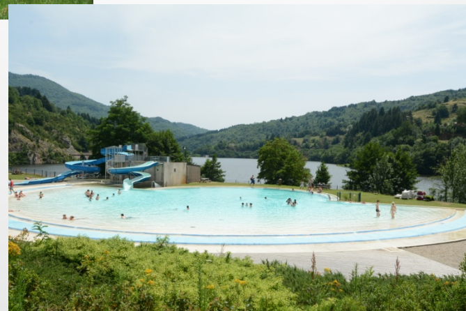
Base aquatique Eyrium Les Nonières