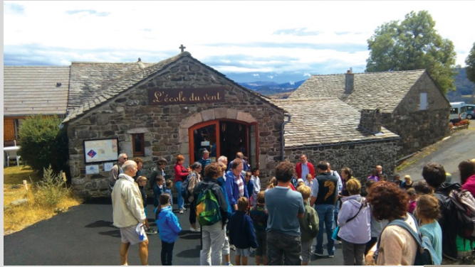
L'école du Vent St-Clément