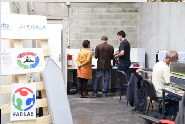
Le fablab La Fabritech