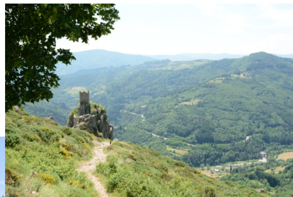
Château de Rochebonne St-Martin-de-Valamas