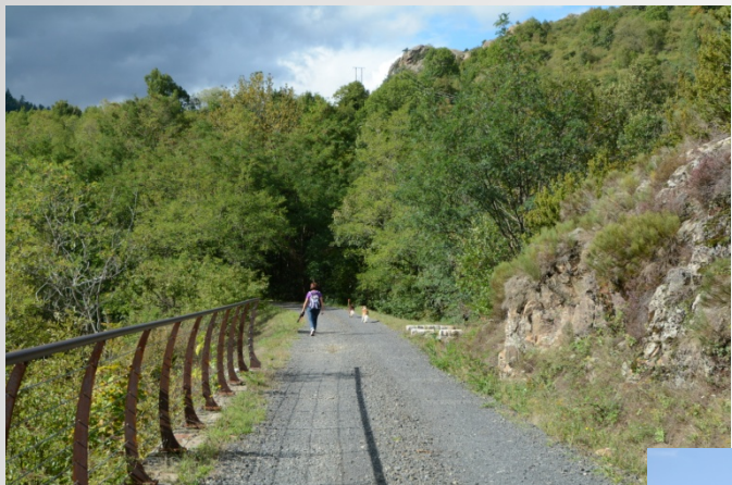
Voie douce La Dolce Via